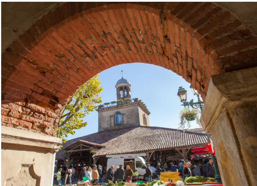
Marché et beffroi de Revel