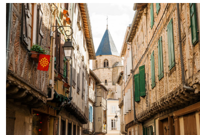
Balade dans les rues de Sorèze