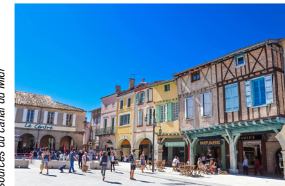
La place Philippe de Valois à Revel