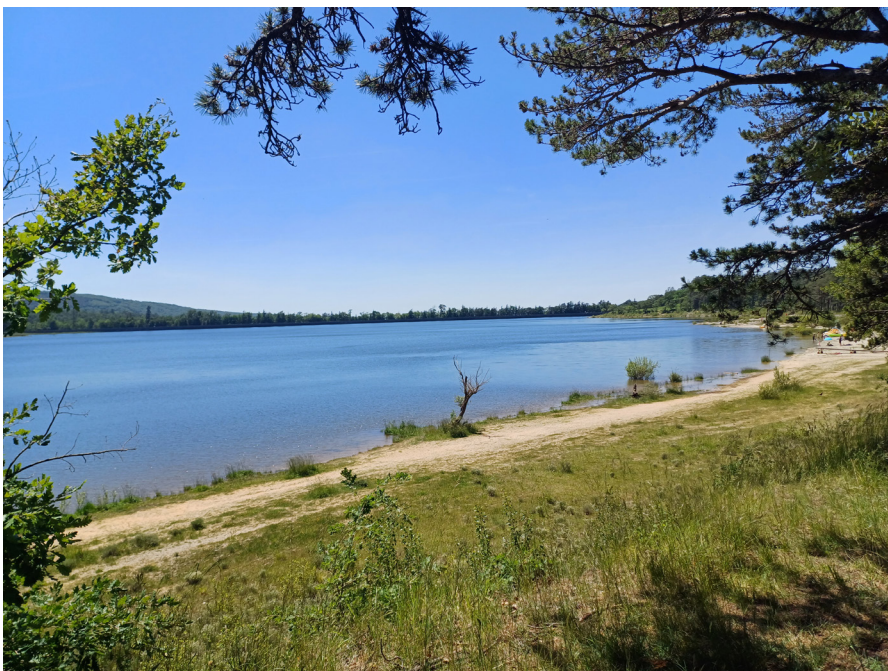
Le lac de Saint-Ferréol