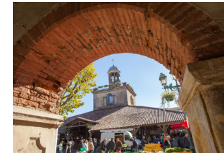
Balade dans les rues de Sorèze