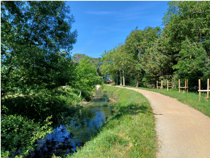
Le chemin d'En Berdure - Vue sur la Montagne Noire