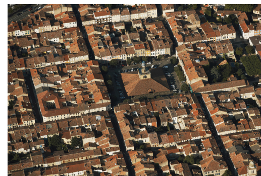
Revel, vue du ciel