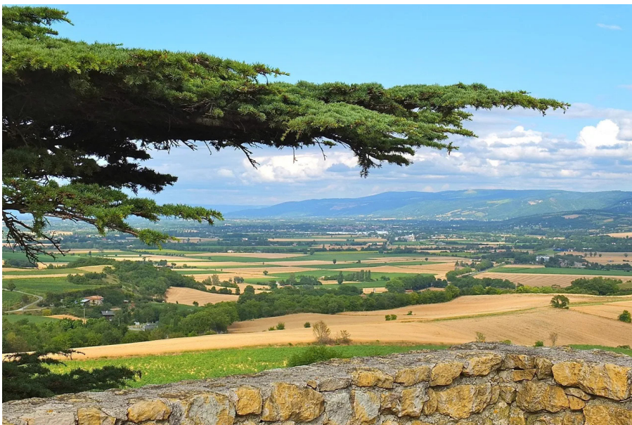
Saint-Félix-Lauragais - Panorama sur la Montagne Noire