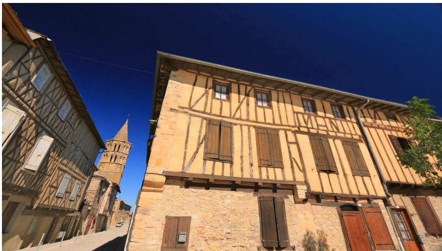
Au coeur du village de Saint-Félix-Lauragais