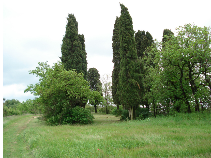
Cimetiére des Anglais de Saint-Félix-Lauragais