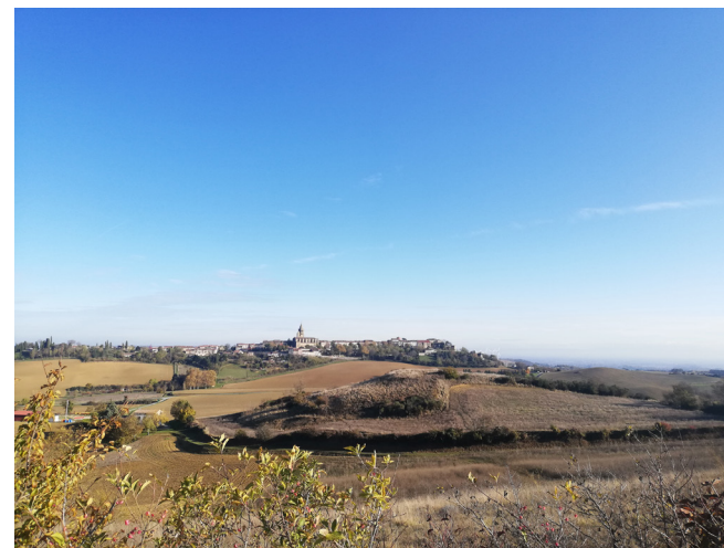
Vue sur Saint-Félix-Lauragais

6 Monter à gauche vers le village. Obliquer à droite sous le cimetière. Prendre à gauche le passage piétonnier entre jardin et maison qui débouche sur une autre rue, puis monter l'escalier à gauche. Traverser la D 622 devant l'auberge et prendre la rue principale qui monte en face pour rejoindre la halle.