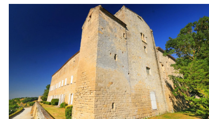
© GILLES DESCHAMPS / Destination Aux sources du canal du Midi