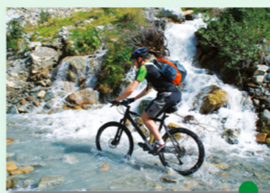
Traversée de ruisseau

Ces massifs verdoyants offrent la fraîcheur des rivières, torrents et ruisseaux qui ont creusé le vaste réseau souterrain de la Coume Ouarnède à Arbas, bien connu des spéléologues du monde entier.