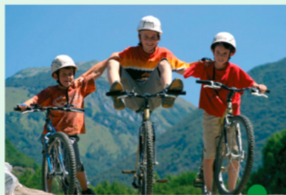
Des parcours pour tous

Cet environnement exceptionnel se découvre au long des 600 kilomètres de sentiers balisés. Vous trouverez, quels que soient vos goûts et vos capacités, le parcours qui vous convient : balade familiale ou randonnée engagée. Vous pourrez enfin apprécier la convivialité de notre accueil et de nos prestations.