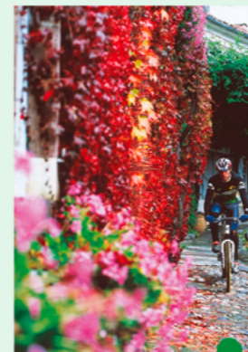
Village de Saint Bertrand

Le patrimoine culturel révèle aussi une histoire ancienne et riche à Saint Bertrand de Comminges, ancienne cité gallo-romaine et moyenâgeuse, dominée par sa cathédrale du 13ème siècle. D'autres témoignages de cette histoire sont parsemés sur le territoire, églises romanes, autels votifs gallo-romains, carrières de marbre et vestiges de fortification à Saint Bât, aux portes de l'Espagne.