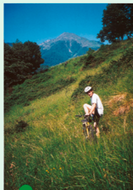
Le Pic du Cagire

Aux confins des Pyrénées centrales, ce petit territoire illustre bien l'authenticité et la nature sauvage des Pyrénées.